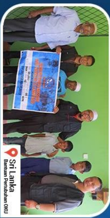
Sri Lanka Bantuan Pendidikan ORU